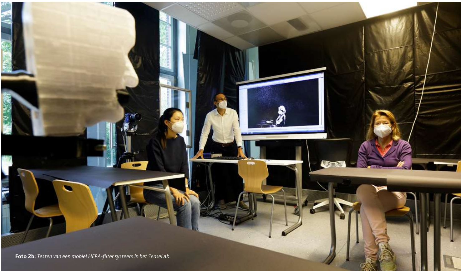
Foto 2b: Testen van een mobiel HEPA-filter systeem in het SenseLab.

In veel berichten over COVID-19 wordt de hoeveelheid ventilatie van een binnenuimte uitgedrukt in het aantal malen per uur dat de lucht wordt verversed ('Air Changes per Hour' - ACH). Er worden zelfs aanbevelingen gedaan op basis van deze ACH-maat, bijvoorbeeld: 6 luchtverversingen per uur. Toch is dit geen goede maat, omdat een ACH die voldoende is voor één type ruimte, bijvoorbeeld een woonkamer met 3 personen, niet adequaat is voor een bus met 30 personen. Hetzelfde geldt voor een ventilatiehoeveelheid van bijvoorbeeld