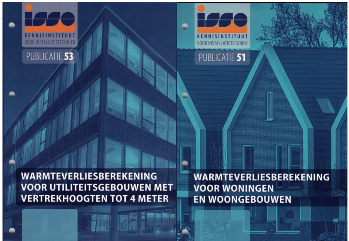
Figuur 1: Nieuwe uitgaven van ISSO publicaties warmteverliesberekening.