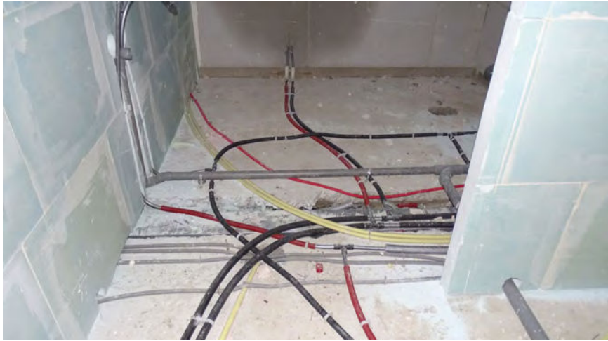
-Figuur 1- Integraal ontwerp vaak nog ver te zoeken

voor de totstandkoming van installaties (in de U-bouw) gewerkt volgens de fasen voorontwerp, definitief ontwerp, bestek en werkbeschrijving, werkvoorbereiding en realisatie. Alles in interactie en gelijktijdig met het bouwkundig ontwerp. Voor leidingwaterinstallaties in woningen is er meestal geen sprake van een voorontwerp en definitief ontwerp, omdat de woning in bouwkundig opzicht al definitief is. Daarbovenop komt het feit dat bij nieuwbouw ook de warmtapwaterbereider al gekozen is door middel van de bij de bouwaanvraag behorende Energieprestatieberekening (EPC). Met andere woorden, de leidingwaterinstallatie kan nog maar op één manier worden ontworpen.