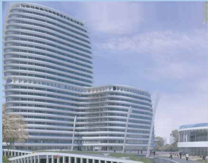
PPS Huisvesting IB-Groep en Belastingdienst Groningen.