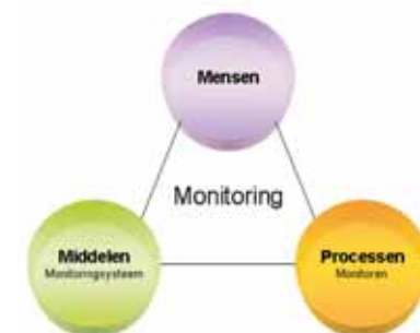
Mensen, Processen en Middelen.

De registratie, signalering en opvolging worden gerealiseerd door een combinatie van samenwerking van mensen, processen en middelen. Deze elementen moeten in een monitoringplan helder worden omschreven, voordat het monitoringsysteem kan worden geïmplementeerd. Dit komt