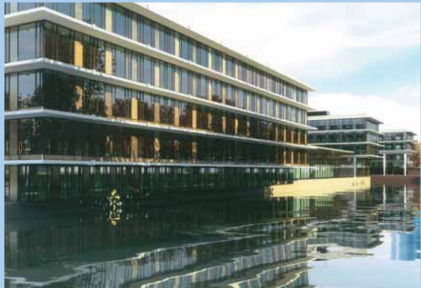
PPS Kromhout Kazerne Utrecht.