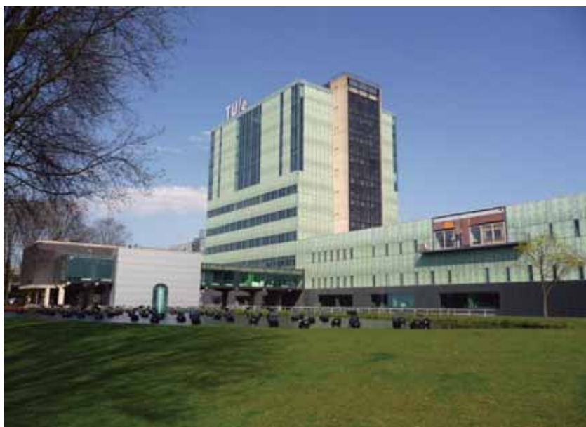
Foto van het Bouwkunde gebouw (Vertigo).

De constructie bestaat grotendeels uit ongeïsoleerd beton. Voor de isolatie