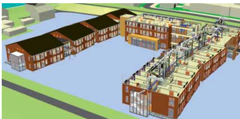
Ruimtelijke representatie van ontwerpgegevens in 3D BIM.

In verschillende industrieën, in het bijzonder op werktuigkundig gebied en luchtvaartindustrie, heeft men daarom in het verleden gezocht naar het verbeteren van de communicatiemogelijkheden. Hierbij zijn zij driedimensionale computertechnieken gaan gebruiken. Langzamerhand beginnen deze werkwijzen ook in de bouwwereld meer voet aan de grond te krijgen. De benodigde capaciteit en software zijn inmiddels voor