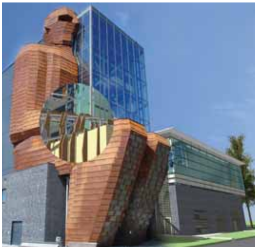
Integrale ontwerpcoördinatie CORPUS, Oegstgeest. - FIGUUR 4 -

planningbeheersing (Spoorwegmuseum) als op het gebied van integrale technische hoogstandjes als vorm, bouwkunde, constructie en installaties (Corpus). Zoals altijd met nieuwe ontwikkelingen, vergt ook het toepassen van een 3D BIM een zorgvuldige aanpak. Vooral op gebied van gebouwinstallaties zal het gebruik van een 3D BIM grote invloed hebben op de werkwijze, maar de resultaten zullen opzienbarend zijn.