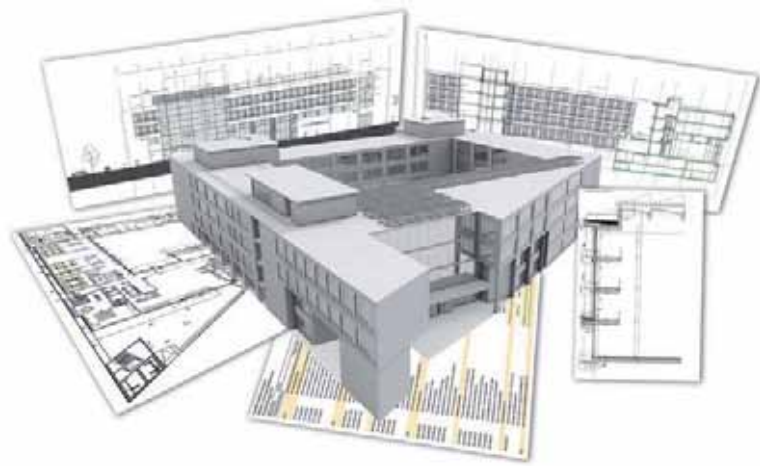
Technische informatie komt rechtstreeks uit het 3D BIM.

Een volgende stap is dat alle berekeningen kunnen worden uitgevoerd door de betreffende rekentechniek direct aan het BIM te koppelen. Met andere woorden, de input voor een transmissieberekening, koellastbereke-