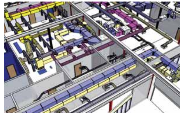
Integrale ontwerpafstemming met input van de installatieadviseur en installateur.

werkmethode en meer input van de installatieadviseur en installateur, maar het zal in de praktijk leiden tot een betere ontwerpafstemming, het gezamenlijk oplossen van ontwerpconflicten en met minder faalkosten tijdens de uitvoering als resultaat.