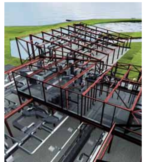
3D BIM levert inzicht en transparantie op voor alle partijen, inclusief de opdrachtgever

Binnen de samenwerking van een projectteam zullen dus ook verschuivingen plaatsvinden. Een centraal opgebouwd 3D BIM ontstaat niet vanzelf. Zelfs wanneer de architect, constructeur en adviseurs met een eigen 3D-software werken, en zelfs als de informatie uit deze pakketten onderling uitwisselbaar is, moet toch iemand de verantwoordelijkheid voor het totale BIM dragen. Deze rol van BIM-manager is een nieuwe taak die door één van de partijen kan worden vervuld, of door een in BIM gespecialiseerd bureau. De BIM-manager moet goede autorisatieafspraken maken om te voorkomen dat iedereen zelf in een centraal model kan muteren, met als risico dat werk van anderen ongewenst wordt beïnvloed. Het geniet de voorkeur, de BIM-manager het centrale 3D BIM te laten opbouwen en beheren. Vooral wanneer partijen in een projectteam zelf (nog) niet veel ervaring hebben met BIM, is het verstandig om de eigen werkzaamheden volgens eigen (traditionele) methodes te blijven verrichten en aan te leveren aan de BIM-manager. Moderne communicatietechnieken maken het tegenwoordig zeer eenvoudig om op afstand mee te kijken bij het verwerken van de data. Wel is het van belang om vooraf met elkaar af te spreken welke 3D BIM doelstellingen voor iedere partij moet worden behaald. Op basis van deze afspraken kan de BIM-manager bepalen hoe en wanneer de gegevens in het model moet worden ingebracht en