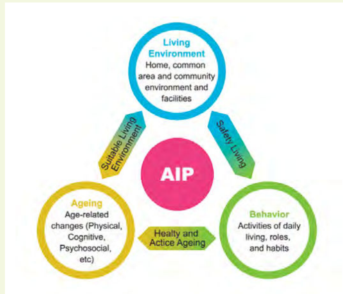
-Figuur 1- Concept van dienstverlening rondom langer thuis wonen binnen de ERC