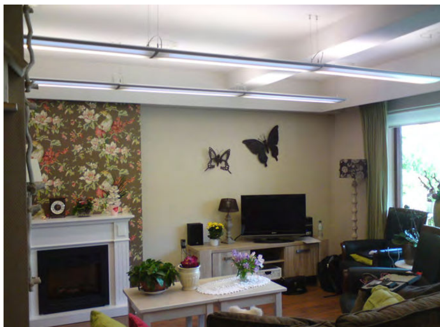
-Figuur 3- Nieuwe verlichting met een kleurtemperatuur van 2.700 Kelvin (warmwit – 827)