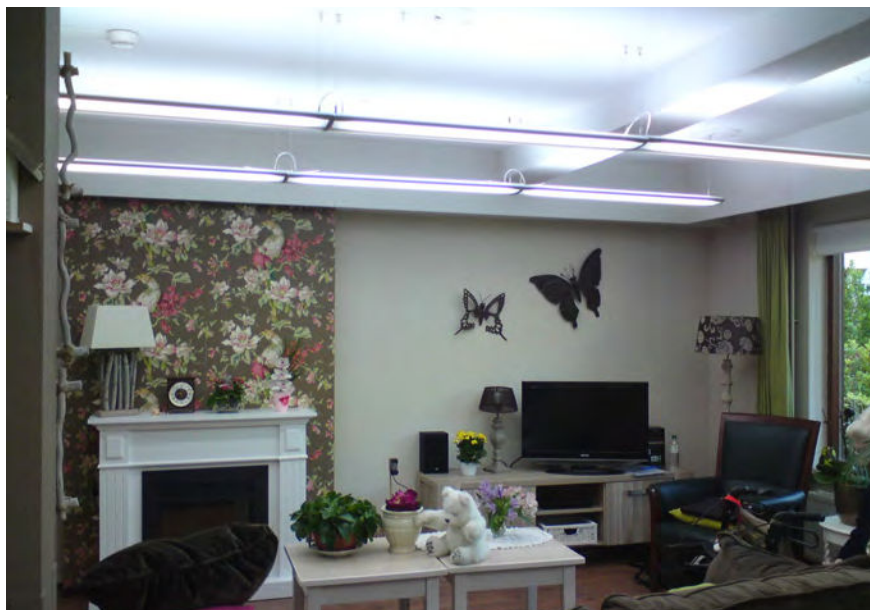
-Figuur 4- Nieuwe verlichting met een kleurtemperatuur van 6.500 Kelvin (koelwit – 865)