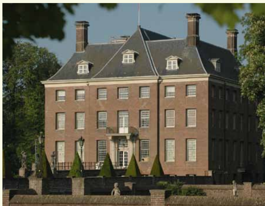
Kasteel Amerongen