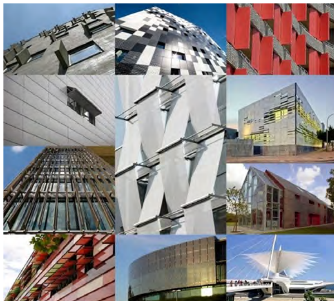
-Figuur 1- Voorbeelden van adaptieve gevels. Een uitgebreid overzicht met 400 voorbeelden is beschikbaar op www.pinterest.com/ CABSoverview [1]

De gevel zoals die traditioneel wordt ontworpen en gemaakt, is in hoofdzaak een statisch systeem. Eigenschappen, zoals thermische massa, isolatiewaarde, albedo en de verhouding 'open' en 'dichte' delen, zijn het hele jaar door nagenoeg gelijk. Zon- en lichttoetreding kunnen vaak slechts met handmatig geregelde (binnen)zonwering gereguleerd worden. Op het gebied van energiebesparing en comfort leidt dit tot een niet-optimale situatie, omdat veelal niet adequaat en tijdig op wisselende binnen- en buitencondities kan worden ingespeeld. Een dergelijke statische schil is eveneens niet ingesteld op verandering van functie gedurende de levensloop van een gebouw of veranderende eisen in de toekomst vanuit klimatologisch perspectief. Dit leidt tot onnodig frequente gevelrenovatie en een groot beslag op materialen en energiegebruik.