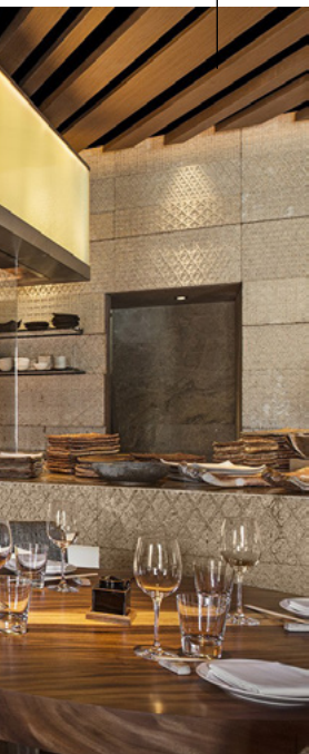
Afbeelding 1: Voorbeeld van een afzuigkap boven een BBQ van 1,5 meter lang.

volume door sleuven onderin de binnenzijde van de kaprand. Deze luchtstroom zorgt ervoor dat de dampen van de kookapparatuur beter worden opgevangen en onder de kap blijven om te worden afgezogen. Onafhankelijk onderzoek van TNO toont aan dat dit 9% scheelt in afzuigcapaciteit. Samen met TNO hebben marktpartijen onderzocht hoe de luchtcirculatie in de afzuigkap verder geoptimaliseerd kan worden. Dit heeft inmiddels tot wereldwijde patenten geleid. Een van de innovaties zit in de ronding van het plaatwerk waardoor de opgezogen lucht naar de vetfilters wordt geleid. Standaard bij afzuigkappen voor grootkeukens zitten er meer of minder scherpe hoeken in het plaatwerk. Deze zijn immers productietechnisch het meest eenvoudig te maken. Ze zorgen echter niet voor een ideale luchtcirculatie. Doordat de lucht tegen de hoeken botst, verliest de lucht bij traditionele kappen snelheid en warmte-energie en kan deze onder de kap uitdwarren. Bij het nieuwe model afzuigkap bestaat de binnenzijde van de afzuigkap uit een exact op maat gebogen ronde plaat. Deze ronding zorgt in de praktijk voor een betere circulatie van de afgezogen lucht. Het verschil in effectiviteit is groot, blijkt uit testen die TNO heeft uitgevoerd. Een Nederlandse fabrikant heeft reeds geïnvesteerd in productietechnologie om de grote platen precies in de juiste diameter te buigen, zodat de luchtcirculatie optimaal is.