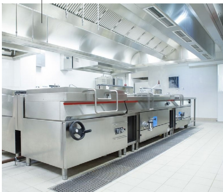
Afbeelding 3: Voorbeeld van een eiland afzuigkap in een showkeuken.