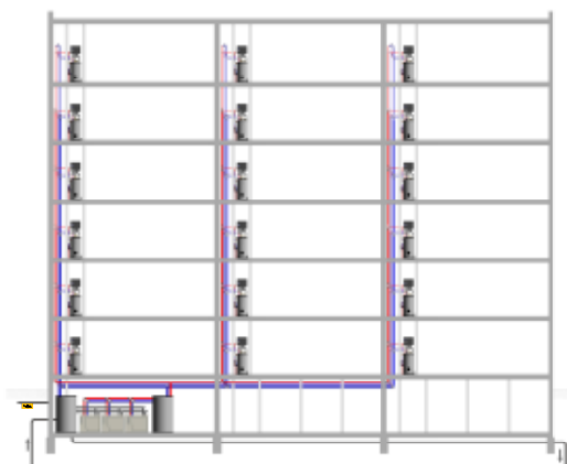
-Figuur 1- Inzet van een boosterwarmtepomp met lagetemperatuurwarmtedistributie

tappunten ook gevoed worden vanuit de circulatieleiding. Hierdoor kunnen de warmtapwaterleidingen die deel uitmaken van het circulatiesysteem kleiner gedimensioneerd worden, met dus minder warmteverliezen. Warmtapwaterleiding en circulatieleiding in één isolatieschil. Door de warmtapwaterleiding, die deel uitmaakt van het circulatiesysteem, en de circulatieleiding in één isolatieschil te plaatsen, vermindert het verliezend oppervlak. Ook bijvoorbeeld het buis-in-buis-circulatiesysteem plaatst de warmtapwaterleiding en de circulatieleiding in één schil.