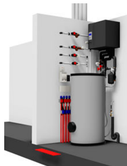
-Figuur 2- Alpha-InnoTec WWB 20 Boosterwarmtepomp

Door het gebruik van de verschillende energie-efficiënte technieken ontstaat een duurzaam totaalconcept. De energie-efficiëntieverbeteringen hebben in dit geval betrekking op: - efficiënte primaire collectieve opwekking met een warmtepomp met open bron of verticale bodemwarmtewisselaars met een COP van circa 6,9;